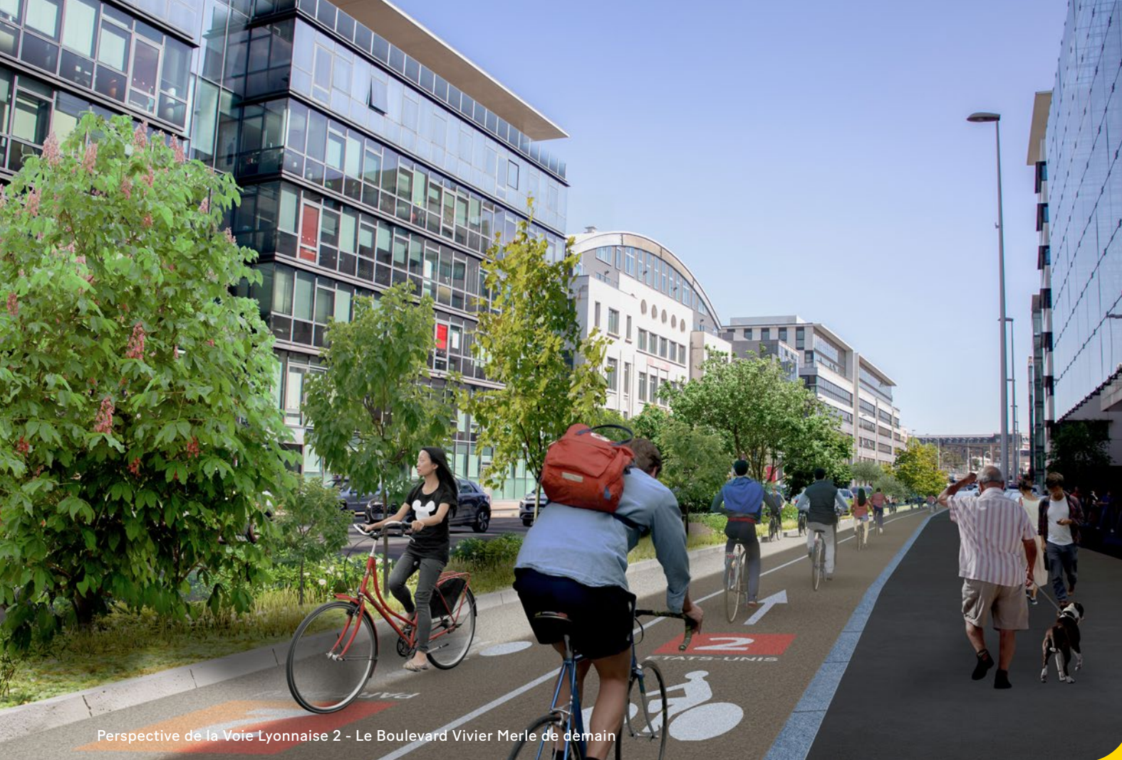
Perspective de la Voie Lyonnaise 2 - Le Boulevard Vivier Merle de demain