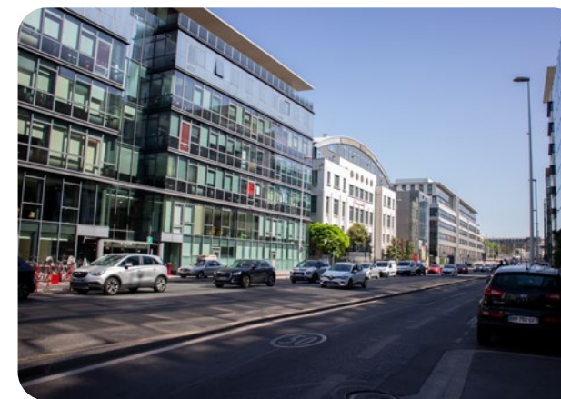
Boulevard Vivier Merle aujourd'hui

Seront accessibles facilement de chez vous, par la Voie Lyonnaise 2 : la Cité Internationale, le Transbordeur, l'entrée ouest du Parc de la Tête d'Or, le métro B à l'arrêt Brotteaux, la gare de la Part-Dieu, la Manufacture des Tabacs... et bien d'autres destinations !